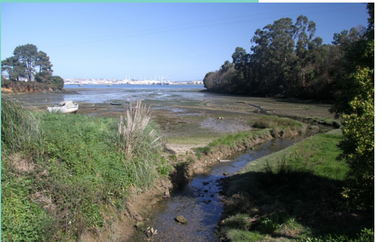
3-Enseada e praia da Barca