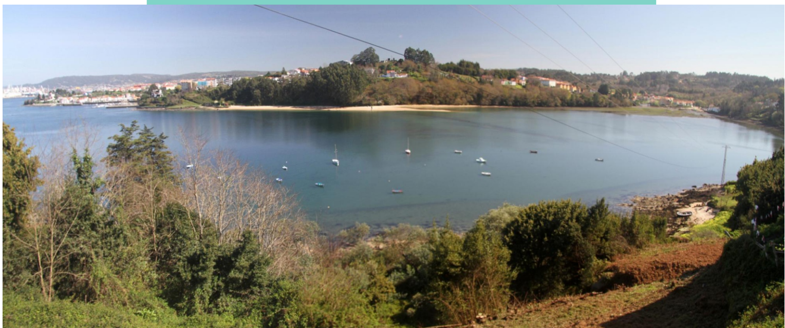
10-Enseada do Baño