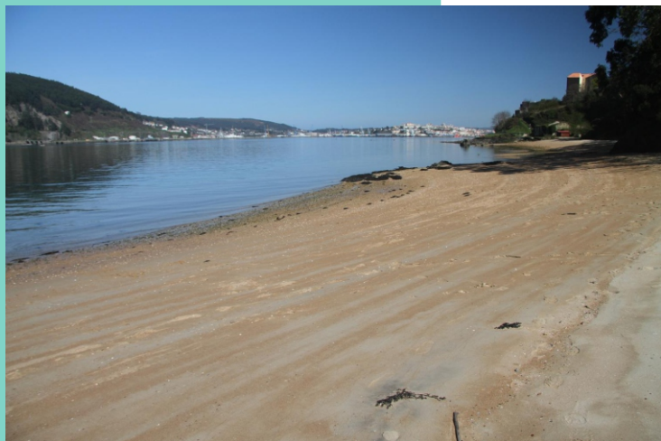
9-Praia de Bestarruza