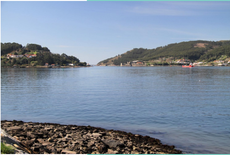
A boca da ría desde a punta Leiras