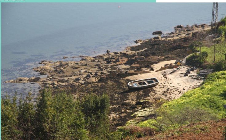
A Redonda de Abaixo