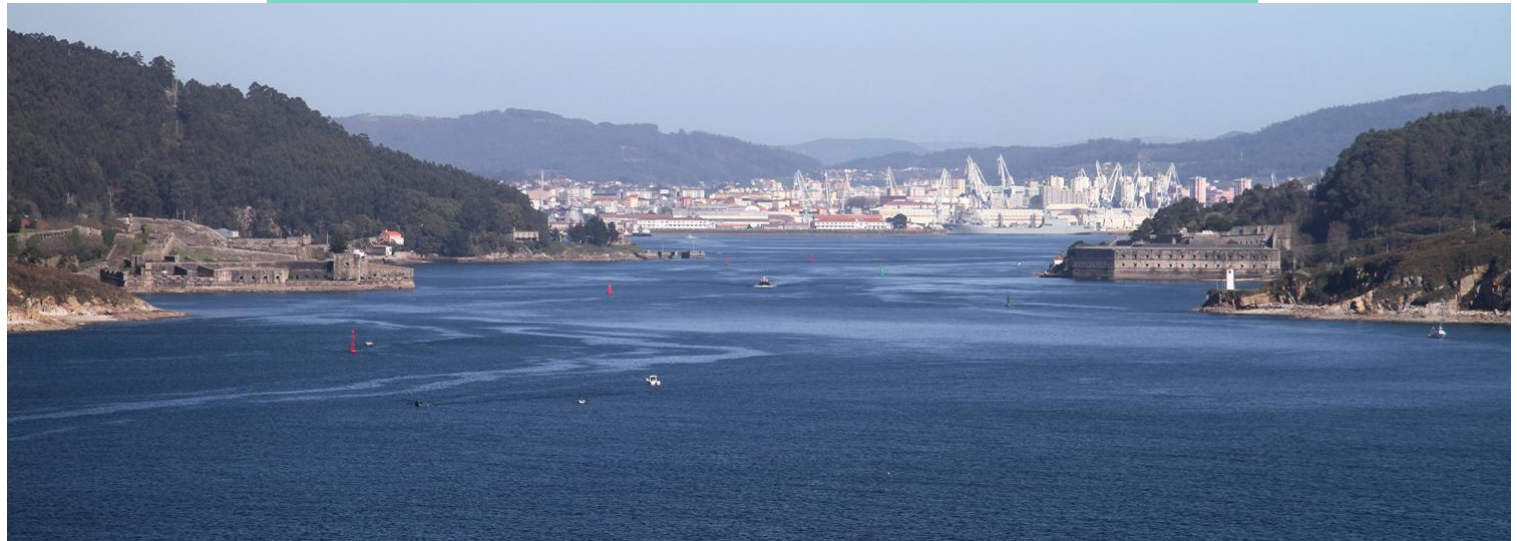
Canle de entrada da ría de Ferrol, de 3 km de lonxitude e 500 m de largor, flanqueada por rochas graníticas. O acceso á parte interior da ría estaba protexido polos castelos de San Felipe en Ferrol e A Palma en Mugardos.