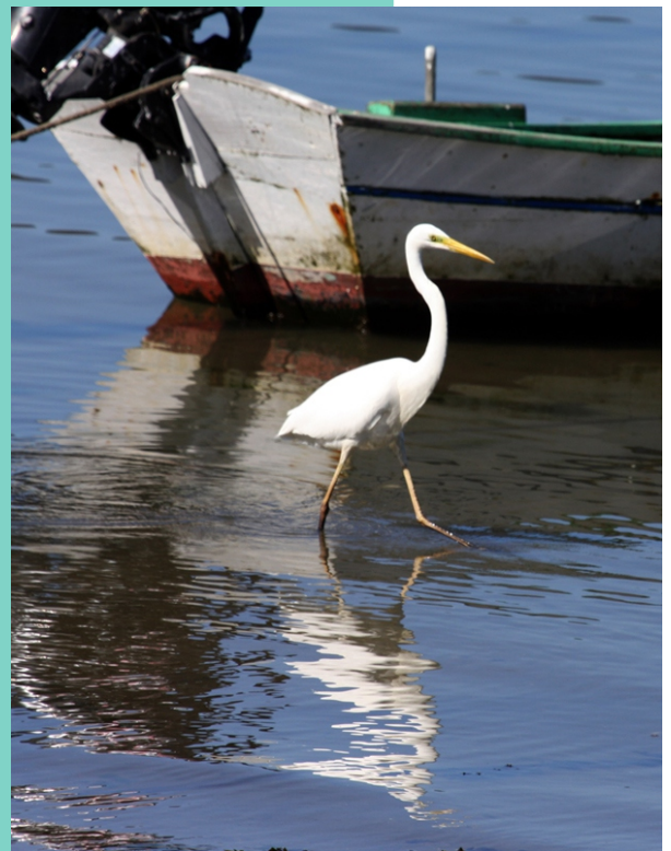
Garzota grande na ribeira de Mugar dos