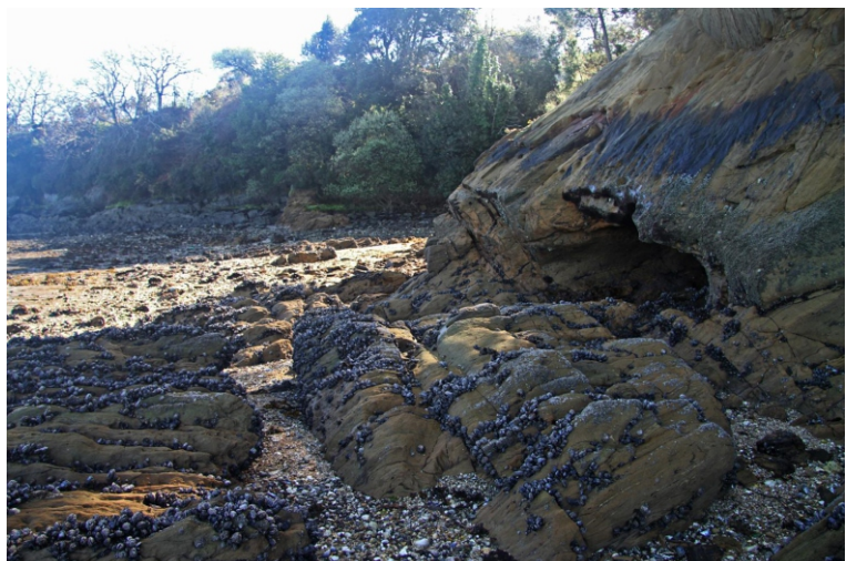
1-Praia e Punta dos Castros