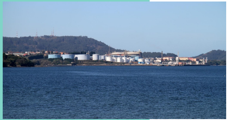
4-Punta Promontorio e regasificadora