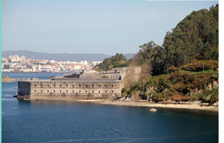
13-Castelo da Palma