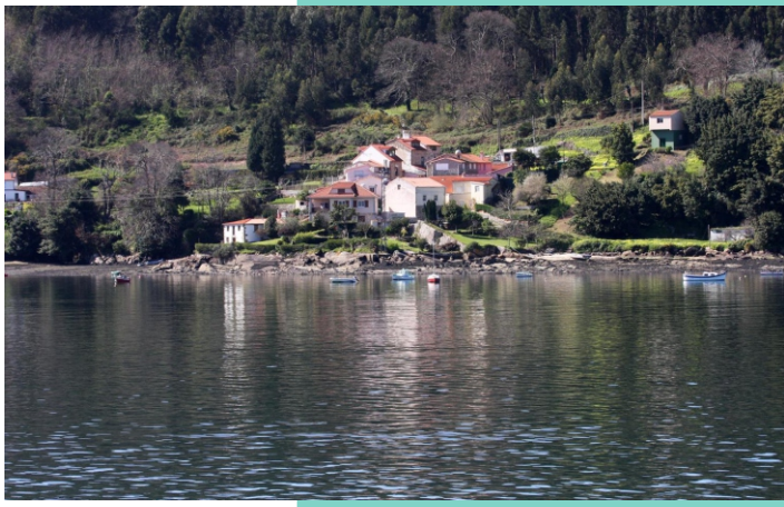
A Redonda de Abaixo