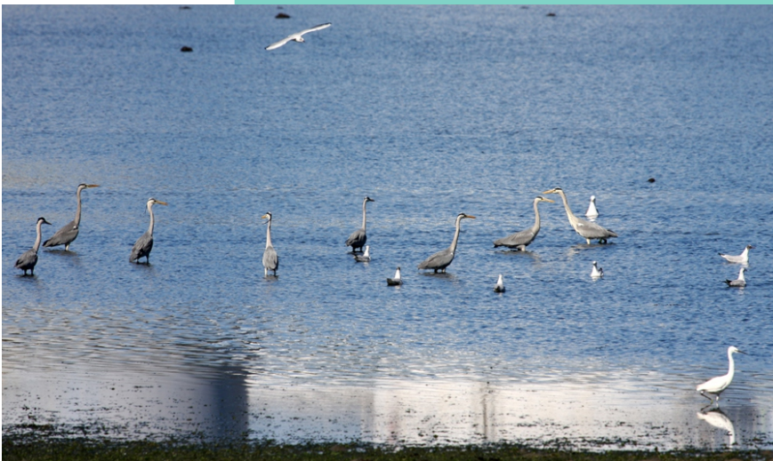
Garzas da enseada da Barca