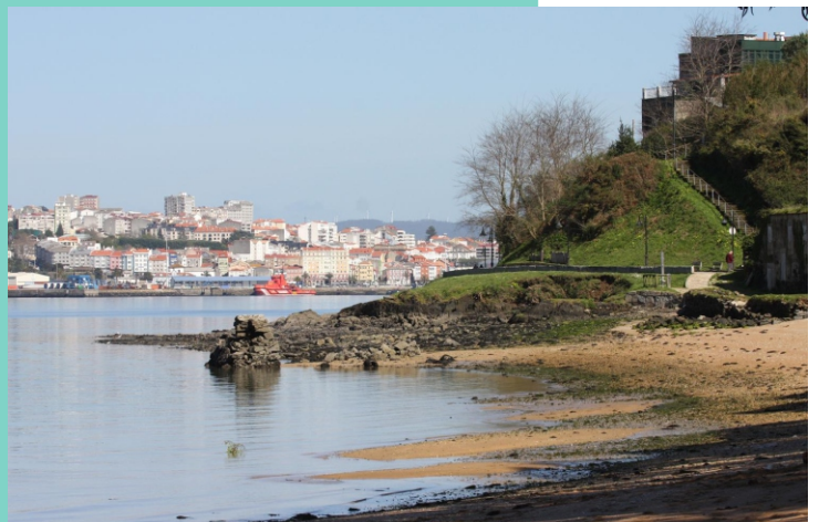
8-Punta do Peteiro