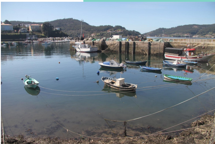
Praia e porto de Mugardos