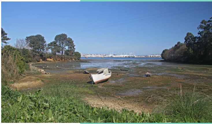
Praia da Barca