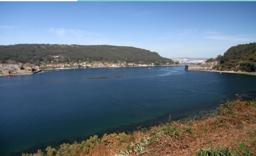
14-Enseada de Nande