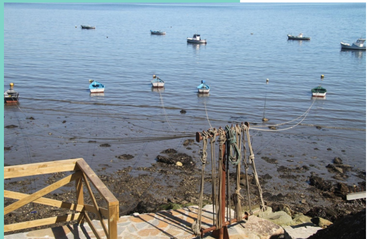
5-Enseada de Santa Lucía desde Meá